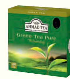
1195 Green Tea 绿茶