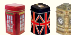
1123 Assorted London Caddies 伦敦风情小礼罐