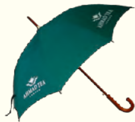
1244 Umbrella 雨伞