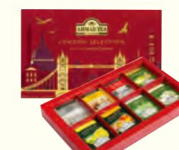
1641 12x8x5 Alu tb London Selection 伦敦精选礼盒(调味茶)