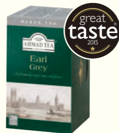
551 Earl Grey 伯爵红茶(调味茶)