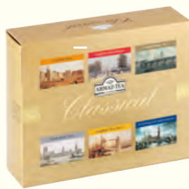
105 Classical Selection 精选红茶(调味茶)