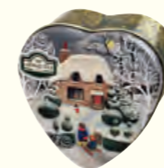
1501 30g Little Heart Caddy Earl Grey 伯爵红茶(调味茶)(小爱心罐)