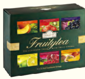
1272 Fruitytea Selection 精选果味茶(调味茶)