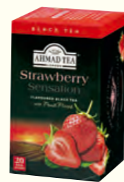
700 Strawberry Sensation (Also Available in 10) 草莓味红茶(调味茶)