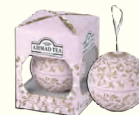
1757(EB)+ 30g Elegant Baubles (Pastel red) English Breakfast 英式早餐红茶(浅红色球罐)