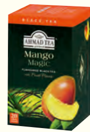
698 Mango Magic 芒果味红茶(调味茶)