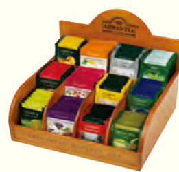
1550 Wooden teabag dispenser (3x per case) 木质茶包展架