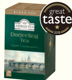
559 Darjeeling Tea 大吉岭红茶