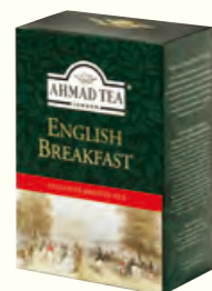
809 250g English Breakfast 英式早餐红茶