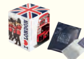
1091 I Love London English Afternoon 英式下午茶(调味茶)(我爱伦敦)