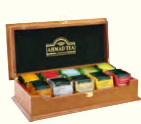
920 Wooden Box Wooden display case for up to ten flavours of teabags (supplied empty). 木质礼盒