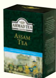
706 250g Assam Tea 阿萨姆红茶