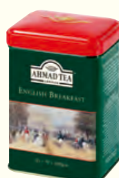
627 English Breakfast 英式早餐红茶