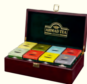
921 Tea Keeper 精品茶礼盒系列(调味茶)