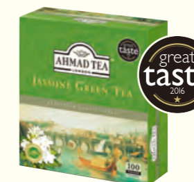
475 Jasmine Green Tea 茉莉花茶