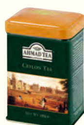
630 Ceylon Tea 锡兰红茶