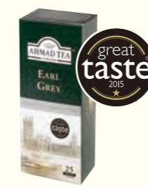
969 Earl Grey 伯爵红茶(调味茶)