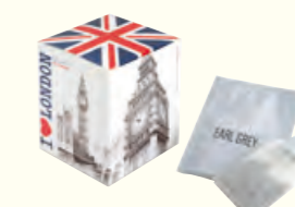
1090 I Love London Earl Grey 伯爵红茶(调味茶)(我爱伦敦)