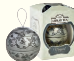
1757(EG) 30g Magical Tea Baubles (Silver) Earl Grey 伯爵红茶(调味茶)(银色球罐)