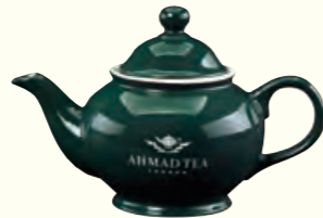
269 Green Teapot (700ml*) 茶壶