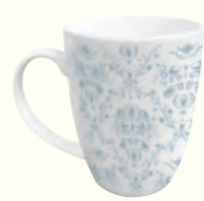
1869 Gift Mug 礼品马克杯