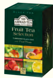
399 Fruit Tea Selection 精选果味红茶(调味茶)