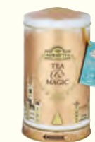
1499 80g Round Music Caddy Earl Grey 伯爵红茶(调味茶)(音乐圆罐)