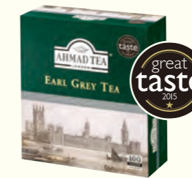
595 Earl Grey Tea 伯爵红茶(调味茶)