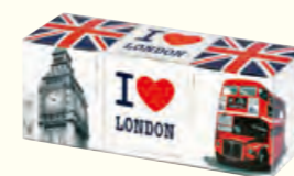
1093 I Love London 我爱伦敦精选礼盒(调味茶)