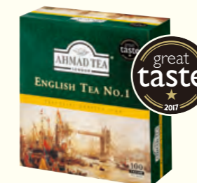
598 English Tea No.1 英国1号红茶(调味茶)