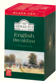
555 English Breakfast 英式早餐红茶