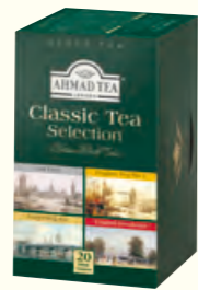
398 Classic Tea Selection 特别精选红茶 (什锦茶)(调味茶)