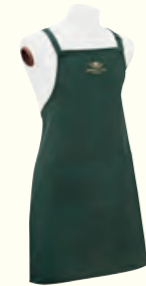
260 Apron 围裙