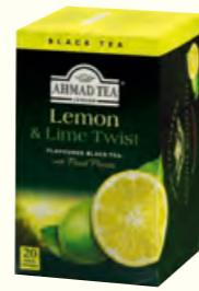
697 Lemon & Lime Twist (Also Available in 10) 柠檬香柠味红茶(调味茶)