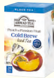
1508 Cold Brew Peach & Passion 水蜜桃百香果味红茶 (冷泡茶)(调味茶)