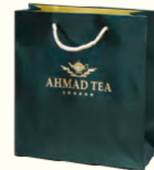
1245 Paper Bag 礼品纸袋