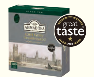
1495 Decaffeinated Earl Grey 低咖啡因伯爵红茶 (调味茶)