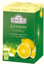
753 Lemon Vitality 柠檬味绿茶(调味茶)