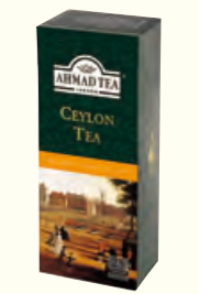
479 Ceylon Tea 锡兰红茶