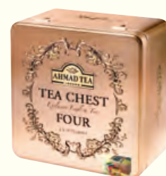
481 Tea Chest Four 四合一精选茶(调味茶)