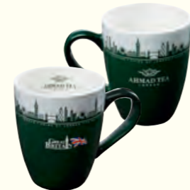
1496 Landmarks of London Mug (340ml*) 伦敦地标马克杯