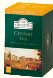
563 Ceylon Tea 锡兰红茶