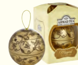
1757(EN) 30g Magical Tea Baubles (Gold) English Tea No. 1 英国1号红茶(调味茶)(金色球罐)