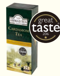
587 Cardamom 豆蔻味红茶(调味茶)