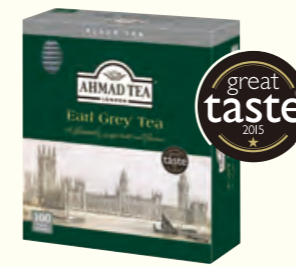
791 Earl Grey 伯爵红茶(调味茶)