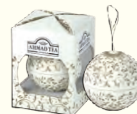
1757(EN)+ 30g Elegant Baubles (Ivory) English Tea No. 1 英国1号红茶(调味茶)(象牙色球罐)