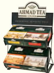
304 100 Teabag Counter Display Stand 产品展示架