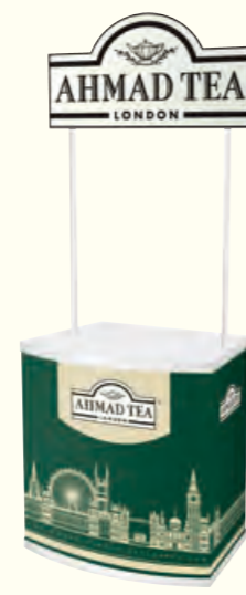
1320 Tasting Booth 品茶展台

* Volume figures quoted are for usable volume *标示的容量为可使用的容量