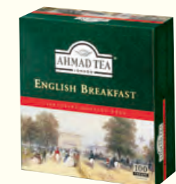
600 English Breakfast 英式早餐红茶