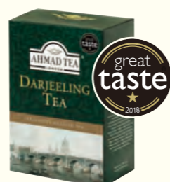
801 100g Darjeeling Tea 大吉岭红茶