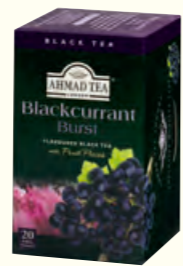
710 Blackcurrant Burst 黑醋栗味红茶(调味茶)