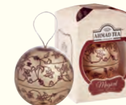
1757(EB) 30g Magical Tea Baubles (Rose Gold) English Breakfast 英式早餐红茶(玫瑰金色球罐)