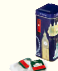
1086B London Icons Caddy 英式早餐红茶(伦敦畅想)(钱罐)