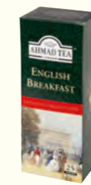
590 English Breakfast 英式早餐红茶