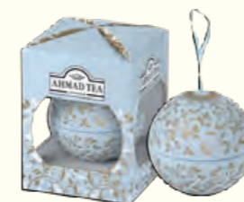
1757(EG)+ 30g Elegant Baubles (Pastel blue) Earl Grey 伯爵红茶(调味茶)(浅蓝色球罐)