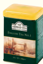
629 English Tea No. 1 英国1号红茶(调味茶)