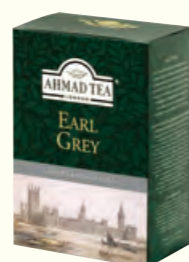
860 250g Earl Grey 伯爵红茶(调味茶)