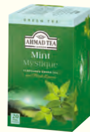
751 Mint Mystique 薄荷味绿茶(调味茶)