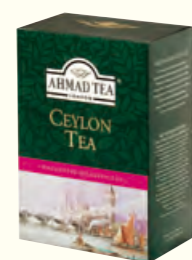
892 250g Ceylon Tea Long Leaf Standard 92 锡兰红茶