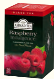
952 Raspberry Indulgence 覆盆子味红茶(调味茶)