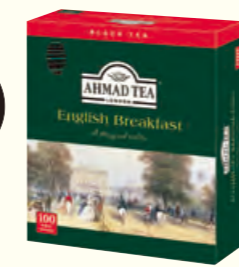
792 English Breakfast 英式早餐红茶