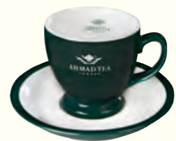
278 Green Cup and Saucer (190ml*) 杯碟