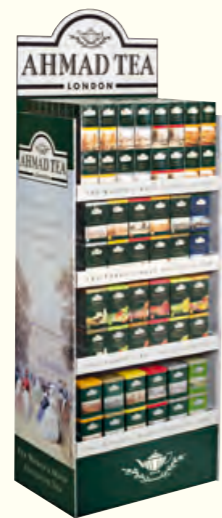
1610 Display stand 陈列架