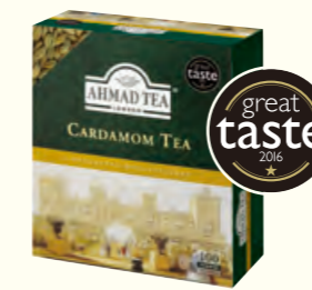
592 Cardamom Tea 豆蔻味红茶(调味茶)