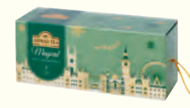
1660 Enchanted Selection 童话精选礼盒(调味茶)