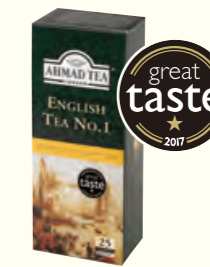
599 English Tea No.1 英国1号红茶(调味茶)