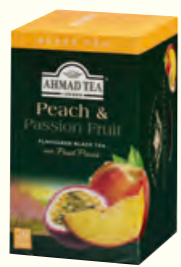
699 Peach & Passion Fruit (Also Available in 10) 水蜜桃百香果味红茶(调味茶)