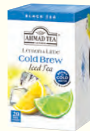
1507 Cold Brew Lemon & Lime 柠檬香柠味红茶 (冷泡茶)(调味茶)