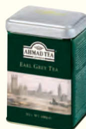
628 Earl Grey 伯爵红茶(调味茶)